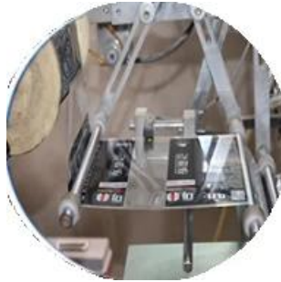
آلة الأعلام المغلفة