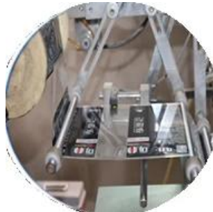
آلة مغلقة بالفيلم