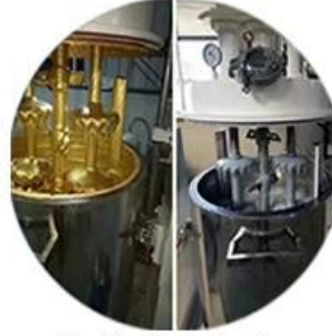
Batching Production Line