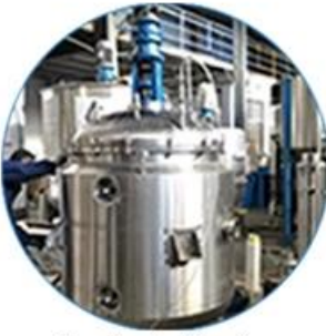
Creaming Machine Line