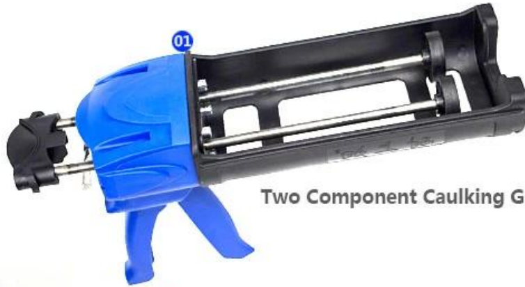
Two Component Caulking Gun