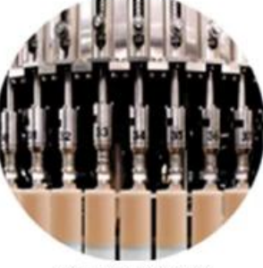
Filling Machine Line