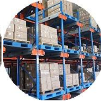
المواد الحقيقية الأسهم