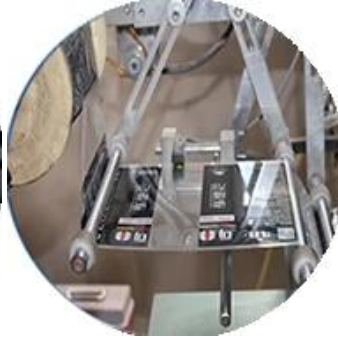
آلة الأفلام المغلقة