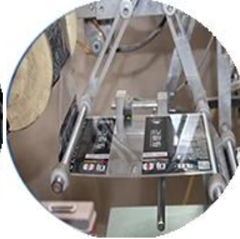
آلة الأفلام المغلفة