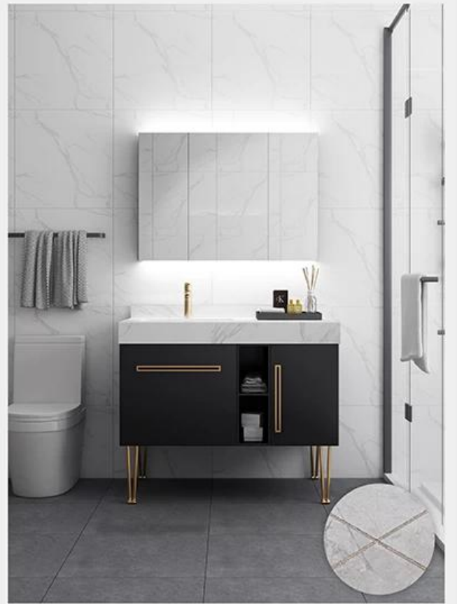
توفير حل الفجوة الغرفة بأكملها