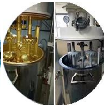
مختبر الأبحاث والتطوير