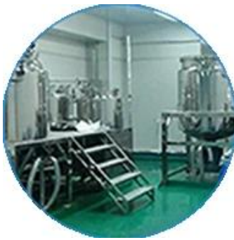
مختبر الأبحاث والتطوير