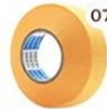
07 Masking Tape