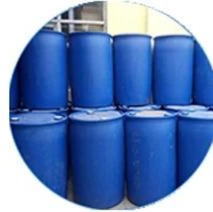
مخزون المواد الخفيفي