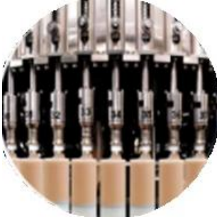
خط ماكينات التعبئة