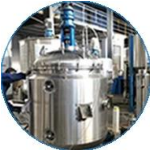
خط كريم آلة