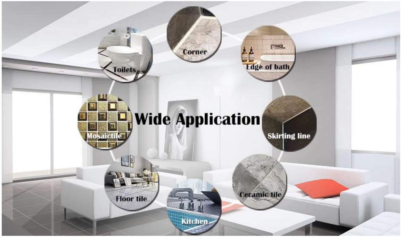
مجموعة متنوعة من الألوان لاختيارك. توفر أيضًا ألوانًا مخصصة.

تتاج الشركة المصنعة للحص حشو البلاط في الصين يمكن استخدامها بشكل أفضل في مفاصل بلاط السيراميك والحجر والزجاج وبلاط الفسيفساء على الحائط أو الدقيق في الحمام والمطبخ وغرفة النوم وما إلى ذلك. الصين بلاط السيراميك كيلين مانع التسرب ناخر الجملة في هذا المجال لمدة 14 عامًا. لدينا فريق البحث والتطوير الخاص بنا مورد لاصق الرخام Kelin والمصنع. لأن حماية البيئة المادية سهلة البناء ، احصل على مصلحة واسعة من المستهلكين. لذا سوف نقدم لك منتجات عالية الجودة. مرجبا بكم في الاتصال الصين الحص الخارجي للماء مصنع عندما تحتاج.