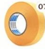
07 Masking Tape