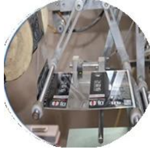
آلة الأعلام المغنطة