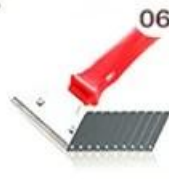
06 Perching Knife