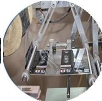
آلة الأفلام المغلفة