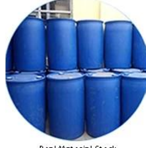
Real Material Stock