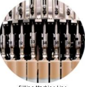
Filling Machine Line