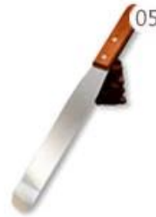
05 Stirring Knife