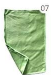
07 Scouring Pad