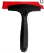
04 Rainbow Scraper