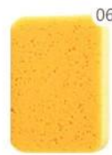
06 The sponge