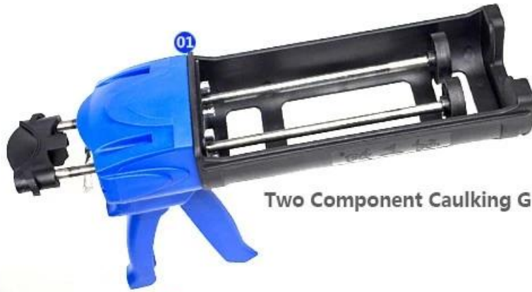
Two Component Caulking Gun