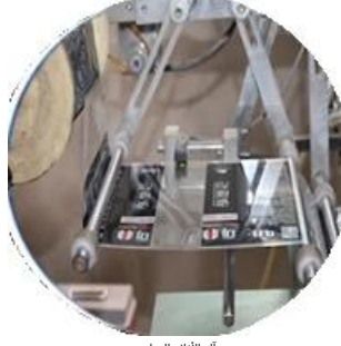
آلة الأعلام المغنطة