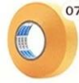
07 Masking Tape