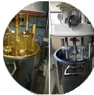
خط إنتاج الخلط