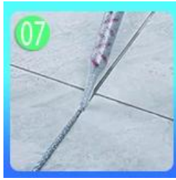
80-60 cm Forepart.