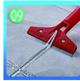
5-4 cm Forepart.