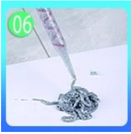
80-60 cm Forepart.