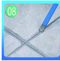
Grous 80-60 cm Forepart.