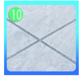
80-60 cm Forepart.