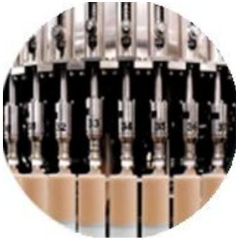
مختبر الأبحاث والتطوير