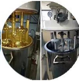
مختبر الأبحاث والتطوير