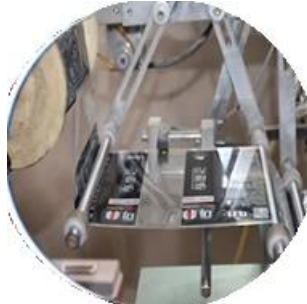
آلة الأعلام المعلقة