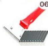
06 Perching Knife