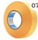
07 Masking Tape