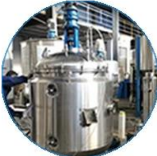
خط آلة الدهن