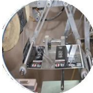
آلة مغلفة بالفليم