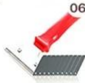
06 Perching Knife