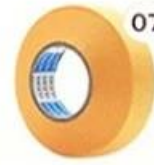
07 Masking Tape