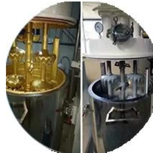
خط إنتاج الحطط